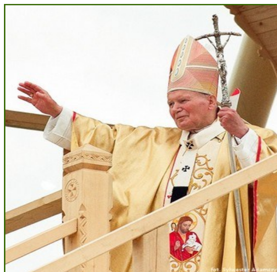
Uroczystość Najświętszego Ciała i Krwi Pańskiej w