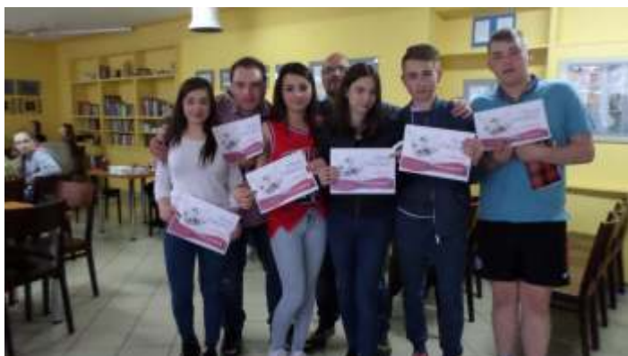
Konkurs historyczno – plastyczny z okazji 100-lecia Konstytucji 3 Maja „Ustawa zasadnicza” 2015