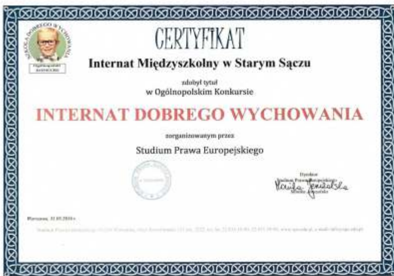
Certyfikat „Internat Dobrego Wychowania” uzyskany w 2016 r.

W roku szkolnym 2015/2016 placówka przystąpiła do projektów „Internat Dobrego Wychowania” oraz „Chrońmy dzieci”.