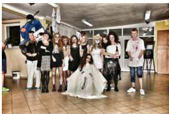
Konkurs na najlepsze przebranie z okazji „Halloween” 2015