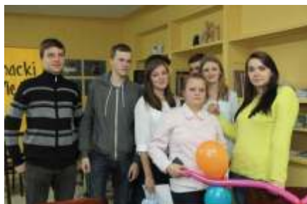
Mi dzyszkolny Konkurs Wiedzy „1 z 10” – 9 XII 2015 r.

W tym samym roku wychowankowie i wychowawcy internatu zorganizowali koncert noworoczny. Po raz kolejny Internat Mi dzyszkolny zago cił na łamach prasy lokalnej: