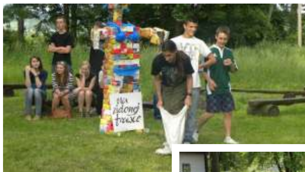
Od 2011 r. organizujemy z okazji Dnia Dziecka „Festyn na zielonej trawce”