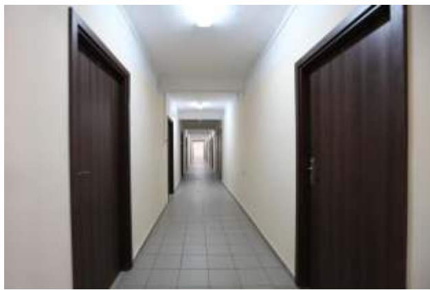
Wygląd korytarza - pawilon B po remoncie w roku 2016

Wartość zrealizowanych prac to 125 000 zł.