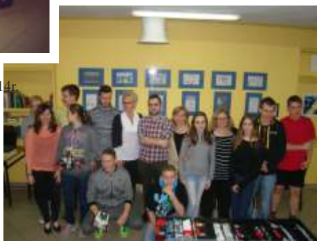
Warsztaty z robotyki 2015r.