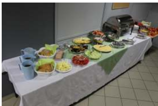
Dla wychowanków Internatu „Szwedzki stół” wprowadzony od roku 2016