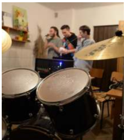
Działalno artystyczna młodzie y w ramach „Pracowni pod Gargulcem” 2010- 2016r.