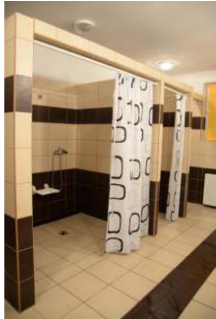
Wygl d łazienek po remoncie wykonanym w ramach projekt pn. „Przystosowanie Internatu Mi dzyszkolnego do pokonywania barier architektonicznych” 2014 r.