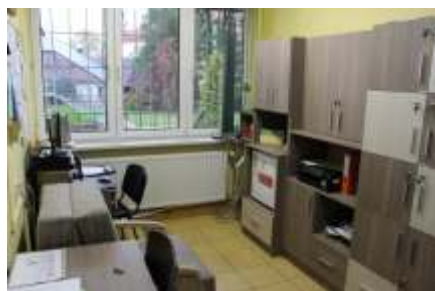
Nowe meble w pokoju nauczycielskim