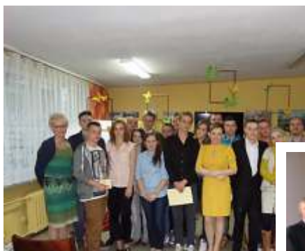
Po egnanie maturzystów 2014r.