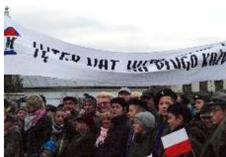
Młodzież internacka wita Prezydenta RP na starostwie na rynku transparentem „INTERNAT WITA PANA PREZYDENTA T WIZYTY NA DŁUGOKAŁY ZAPAMIĘTA”