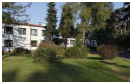
Budynek po ociepleniu ścian i pomalowaniu elewacji w latach 2003 – 2006