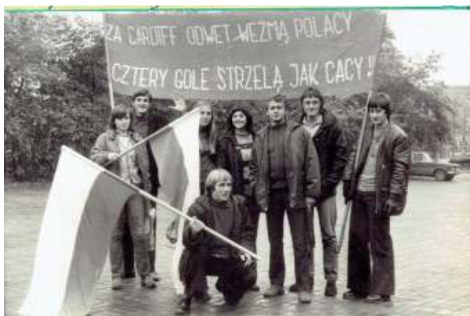
Młodzież internacka przed meczem Polska – Walia w Chorzowie – 1973 r.

Na przełomie lat 70 i 80 mieszkańcy internatu brali aktywny udział w kółkach zainteresowanych działających na terenie Zespołu Szkół Zawodowych im. W. Orkana. 80 % członków zespołów muzycznych stanowiła młodzież z internatu.