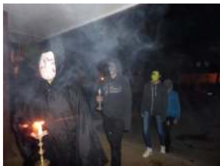
Akcja artystyczna „Maski” 2015r.