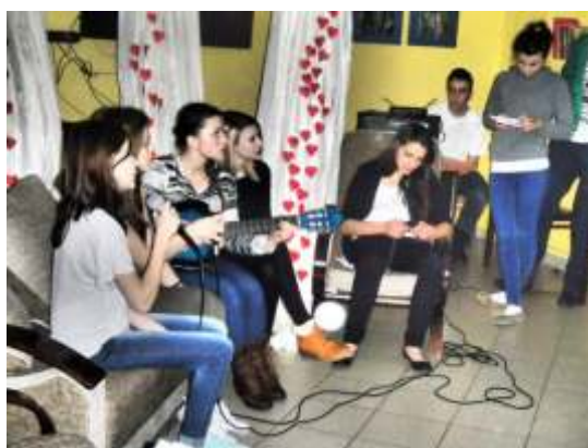
Walentynki (Archiwum Internatu)