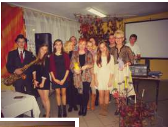
Dzień Pracownika Internatu 2013r. (Archiwum Internatu)

Jako placówka mamy swoje roczne uroczystości i imprezy. Należą do nich m.in. Jubileusz Klas I, Dzień Pracownika Internatu, Wieczera Wigilijna, Spotkanie wielkanocne, 11 listopada, wiązki Konstytucji 3 Maja, Pożegnanie Maturzystów, Uroczyste zakończenie roku Szkolnego oraz organizowany od roku 2011 Festyn na Zielonej Trawce.