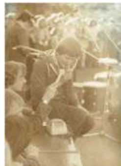
Wyst p internackiego kabaretu „ uczek” – koniec lat 70. (Archiwum Internatu)