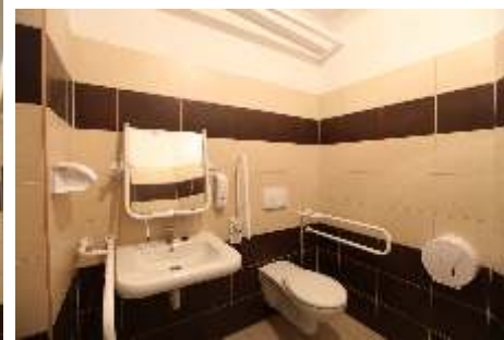
Toaleta dla osób niepełnosprawnych 2014r.