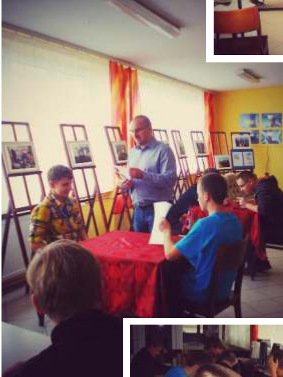
Szkolny etap konkursu „Gen. bryg. pil. Stanisław Skalski – bohater niezłomny” 2015r. (Archiwum Internatu)