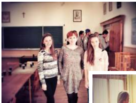
Działalność wolontariatu