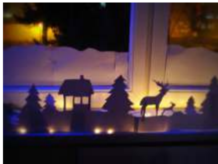
Dekoracje wteczne pokoi wychowanków

Od listopada 2012 roku ukazuje się gazetka „ Echo Internatu ”. Opiekę nad zespołem redakcyjnym sprawuje Elbieta Plata.