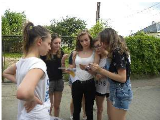
VI Festyn na zielonej trawce – czerwiec 2016 r.