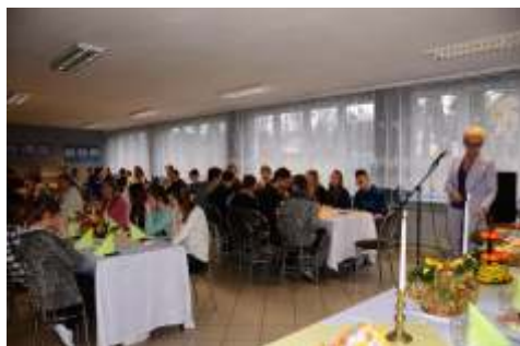
Spotkanie wielkanocne dla mieszka ców placówki wiosna 2015r. (Archiwum Internatu)