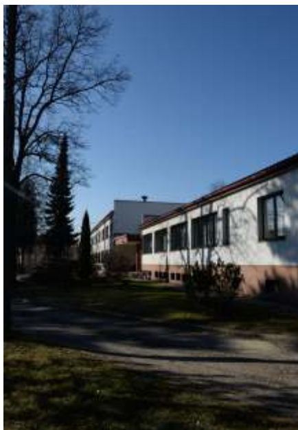
Internat w ró nych odstonach... w 2014r.