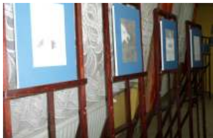
Wrócenie nagród wychowankom w Przeglądzie Twórczości i Plastycznej Internatu Międzydzyszkolnego w Starym Sączu

Wiosną 2015 roku placówka zorganizowała Powiatowy Przegląd Twórczości i Plastycznej i Fotografii Młodzieży Szkół Ponadgimnazjalnych „Z natury i wyobraźni”. 29 kwietnia 2015 roku miało miejsce uroczyste wrócenie nagród laureatom przeglądu.