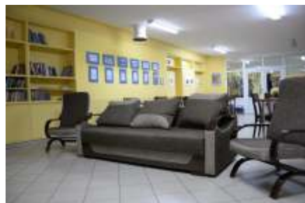
Nowe meble w wietlicy 2014r.