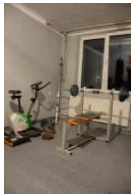
Siłownia po remoncie 2014r.