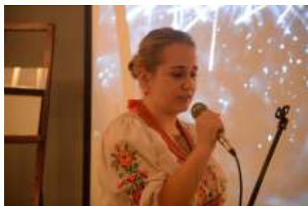
Koncert noworoczny – 22 I 2015 r.

W roku szkolnym 2015/2016 placówka przystąpiła do projektów „Internat Dobrego Wychowania” oraz „Chrońmy dzieci”.