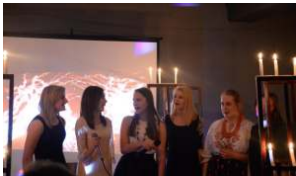
Koncert noworoczny – 22 I 2015 r.