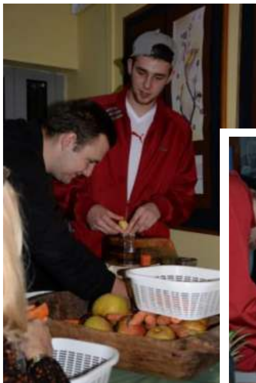
„Dzień Zdrowego Wyżywienia” 2013r.