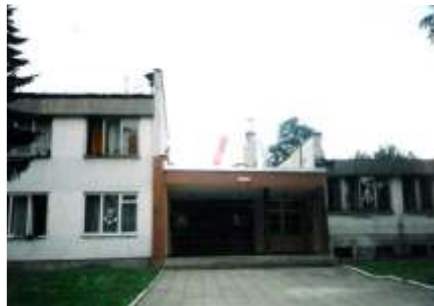
Wygląd budynku w 2. poł. lat 90.