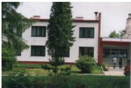
Budynek po ociepleniu cian i pomalowaniu elewacji w latach 2003 – 2006 (Archiwum Internatu)