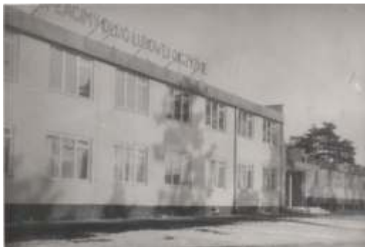
Budynek Internatu w dniu oddania do użytku