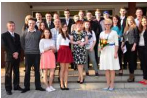
Po egnanie maturzystów 2015r. (Archiwum Internatu)