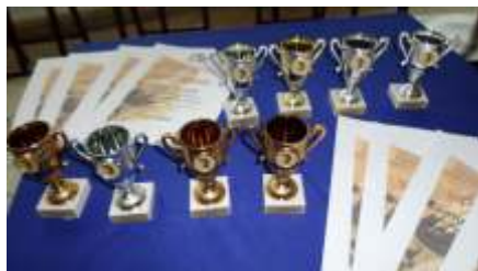
Wręczenie nagród wychowankom w Przeglądzie Twórczości Plastycznej Internatu Młodzieżowego