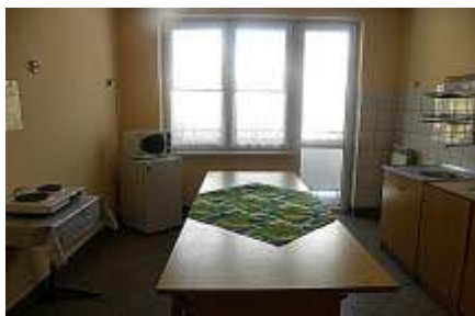
Nowa kuchenka dla młodzie y wykonana w 2002 r. (Archiwum Internatu)