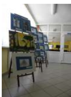
Uroczyste rozdanie nagród w Powiatowym Przeglądzie Twórczości i Plastycznej i Fotografii Młodzieży Szkół Ponadgimnazjalnych „Z natury i wyobraźni” – 29 IV 2015 r.