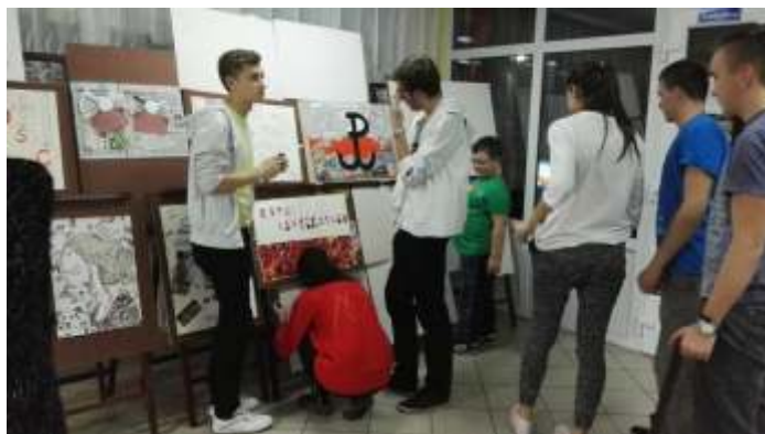
Happening „ciana wolno ci” 2016r.