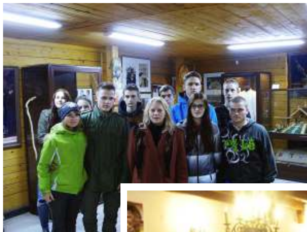
Nasi wychowankowie zwiedzają Muzeum Jana Pawła II w Starym Sączu przy Ołtarzu Papieskim 2014r. (Archiwum Internatu)

Oprócz działających kół zainteresowania organizujemy dla młodzieży wyjazdy do nowosdeckich kin i muzeów, wyjazdy na lodowisko (Nowy Sącz i Krynica), wyjeżdżamy na koncerty w starosdeckim „Sokole”, od 10 lat uczestniczymy w Starosdeckich Dniach Tischnera i odwiedzamy Muzeum Regionalne w Starym Sączu.