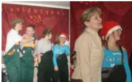
ycie kulturalne placówki w latach 2003 – 2009 (Archiwum Internatu)

W internacie działały te koła zainteresowa oraz Młodzie owa Rada Internatu. Organizowane były imprezy okoliczno ciowe: powitanie klas pierwszych, spotkanie wi teczne, andrzejkki, spotkanie wielkanocne, po egnanie maturzystów.