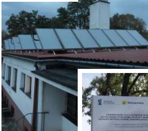
Solary na dachu budynku

Nowa kotłownia wykonana w ramach projektu „Ograniczenie zużycia energii w obiektach użyteczności publicznej Powiatu Nowosiedzińskiego poprzez wykorzystanie odnawialnych źródeł energii” dofinansowanego ze środków Unii Europejskiej 2014 r.