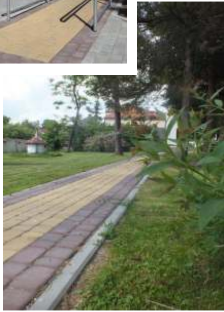
Główne wejście do internatu oraz wejście boczne – dostosowane do osób niepełnosprawnych w ramach projektu „Przystosowanie Internatu Młodzieżowego do pokonywania barier architektonicznych” 2014 r.