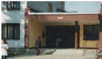
Budynek po wymianie okien w latach 2002 – 2003 (Archiwum Internatu)