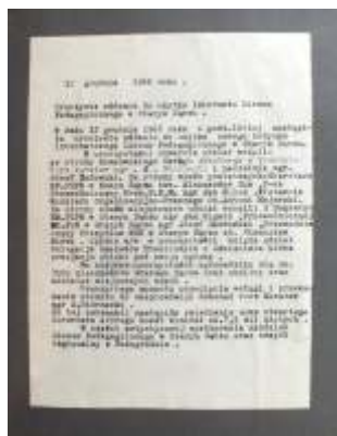
Strona z Kroniki Miasta Starego Sączu – fragment dotyczący oddania do użytku nowego budynku Internatu (ze zbiorów Muzeum Regionalnego w Starym Sączu)

W tym miejscu trzeba niestety dodać przysłowio- wemu k dziegciu do beczki miodu. Mimo iż budynek internatu został dopiero co oddany do użytku zaczęły wychodzić na jaw pewne niedoróbki. Trudno jednoznacznie ocenić, czy były związane z po- piechem w realizacji inwestycji, czy te były spowodowane niską jakością użytych materiałów lub wynikały po prostu z zaniedbań przy budowie obiektu.