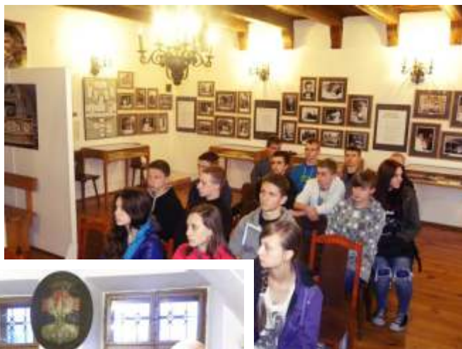
Nasi wychowankowie zwiedzają zabytki i ciekawe miejsca w Starym Sączu 2014r.