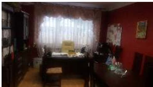
Gabinet Dyrektora 2015r.