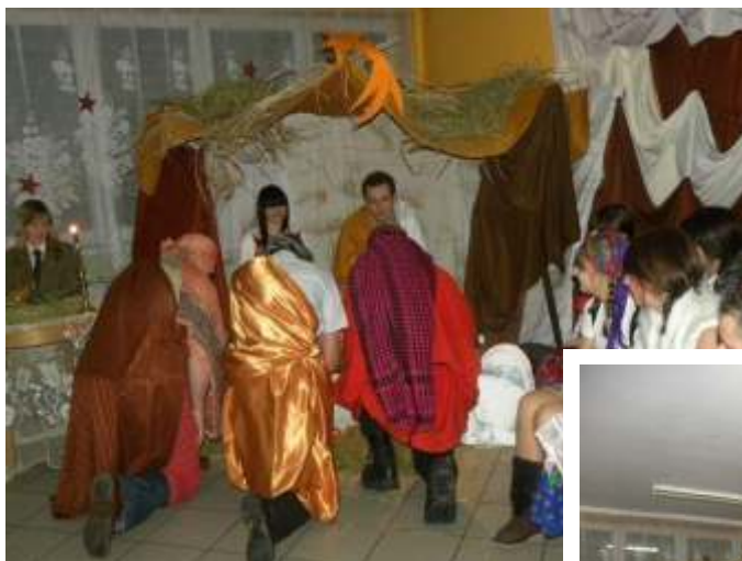
Przedstawienie Bo onarodzeniowe 2012r.