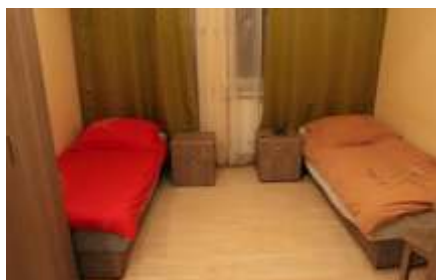
Wykonany w 2016 r. pokój segmentowy z nowym wyposażeniem Trzy pokoje 2-osobowe + łazienka na 6 osób i wspólny korytarzyk z garderob