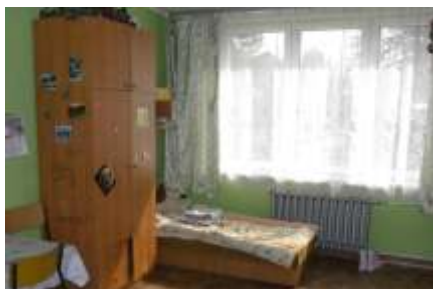
Pokoje wychowanków zostały pomalowane w latach 2007 – 2008