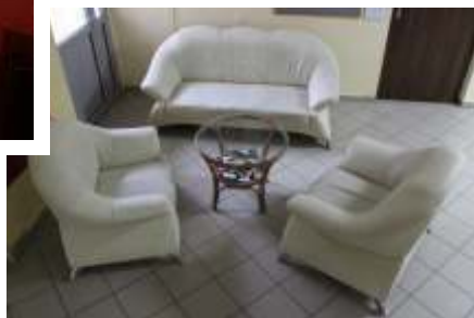
Nowe meble na holu 2016r.