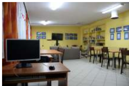
Pomieszczenia placówki po pracach remontowych