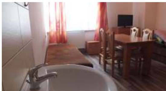
Jeden z wyremontowanych pokoi z zakupionym nowym wyposażeniem 2014r.