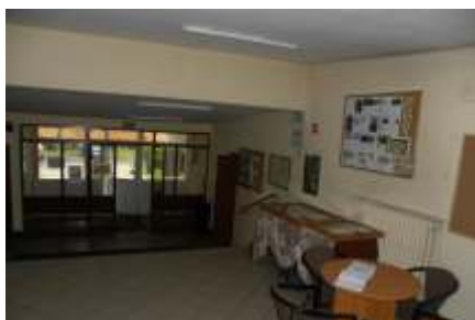
Tak wyglądał hol w 2013r.