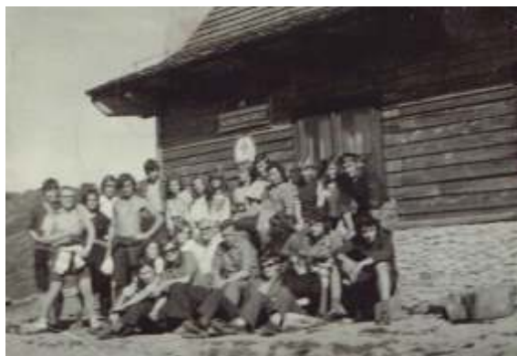
Mieszkańcy Internatu na rajdzie w Bieszczadach – lata 70.