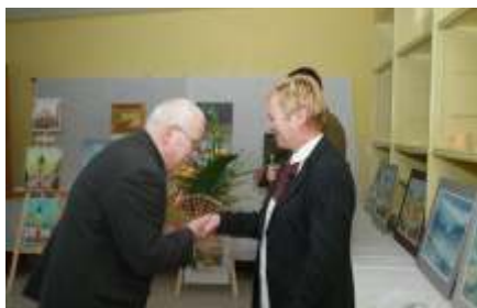
I plener artystów plastyków z Krakowa – rok szkolny 2008/2009 (Archiwum Internatu)