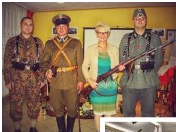
Akademia z okazji 100-lecia Odzyskania Niepodległości w 2014 r. uobogacili pokazem uzbrojenia i wyposażenia członkowie Polskiego Towarzystwa Historycznego o. w Nowym Sączu