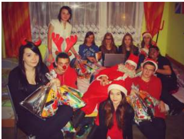
Mikołaj w Internacie 2015