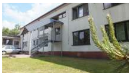
Nowe wyj cia ewakuacyjne wykonane w ramach projektu „Roboty budowlane obejmuj ce remont i dostosowanie budynku Internatu Mi dzyszkolnego w Starym S czu do ogólnych wymaga przeciwpo arowych” 2015 r.