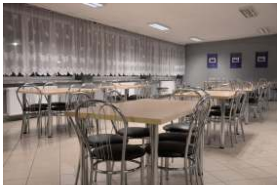
Jadalnia z nowym wyposażeniem. 2013r.