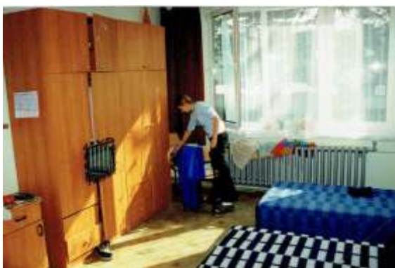
Tak mieszkali młodzie na pocz tku XXI w.

W roku szkolnym 1994/1995 w pomieszczeniu na korytarza w pawilonie B urządzono kawiarenkę dla młodzieży. Znajdowały się tam 4 stoliki, bufet i zestaw do odbioru telewizji satelitarnej. W ten sposób nawiązano do tradycji klubu „Parnas”, jaki istniał w placówce w latach 70.