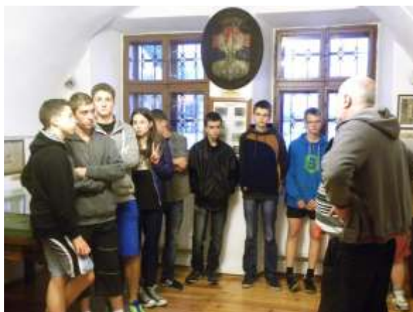
Nasi wychowankowie zwiedzają „Muzeum na dołkach” w Starym Sączu 2014r.