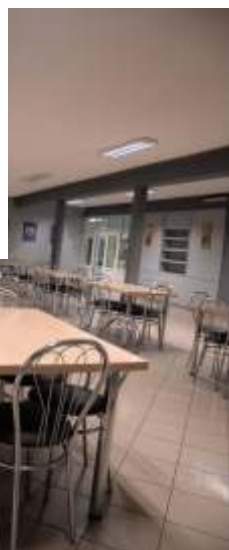
Nowe meble i wyposażenie